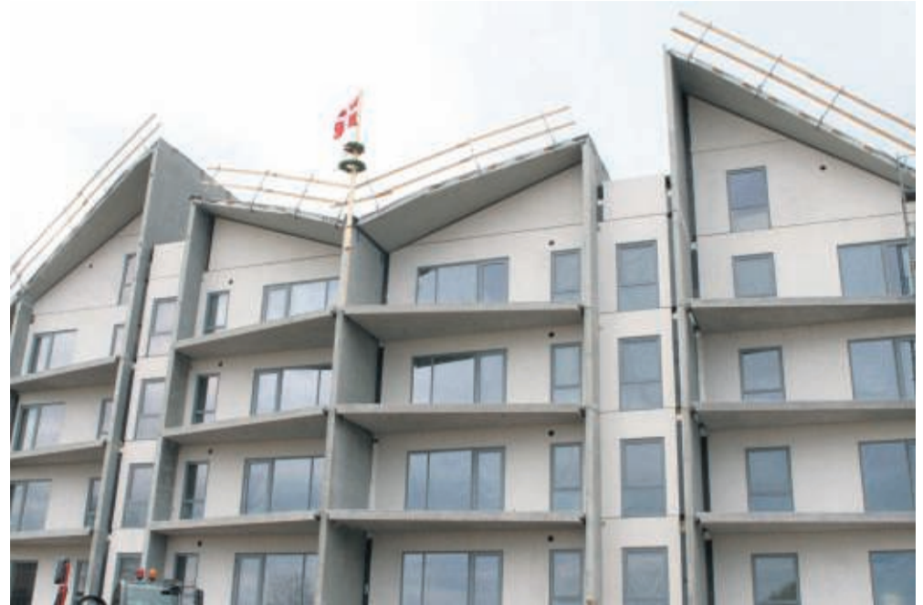
Det udvendige af bygningen er stort set færdigt - nu starter et halvt års arbejde med at gøre det indvendige beboeligt.

»Vi har været heldige med vejret næsten hele vejen, så tidsplanen kan overholdes. Og så er det en drøm, at der er så godt gang i salget.«