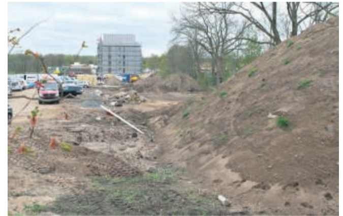
På denne strækning ned mod første bygning, vil flere bygninger skyde i vejret, når anden etape af Søbyen på et senere tidspunkt igangsættes.