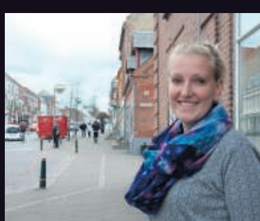
Hun vil hjælpe børn i Tanzania / Læs side 24